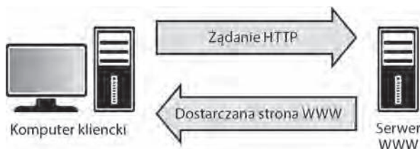
RYSUNEK 1.3. Komunikacja między klientem a serwerem WWW

Na rysunku 1.3 komputer kliencki to maszyna żądająca zasobu z serwera. Głównym zada- niem serwera WWW jest udostępnianie dokumentów HTML i powiązanych zasobów (na przykład zdjęć) w odpowiedzi na żądania klienta. Najłatwiejszy sposób na zapamiętanie ról komputera klienckiego i serwera to wyobrażenie sobie komputera jako klienta, a serwera jako dostawcy usług. Większość profesjonalnych narzędzi informatyki śledczej potrafi skutecznie zarejestrować zawartość pamięci RAM, gdy komputer jest włączony. Dostępnych jest też wiele bezpłatnych narzędzi do analizy pamięci RAM.